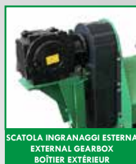
SCATOLA INGRANAGGI ESTERNA EXTERNAL GEARBOX BOÎTIER EXTÉRIEUR